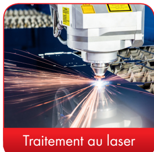
Traitement au laser

De même, graver votre logo et d'autres éléments fait partie des prestations que nous proposons. Bien entendu, nous concevons volontiers vos gravures dans chacune des couleurs de votre choix.