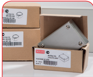
Servicio de muestras

Todo comienza con un asesoramiento personalizado. Le ayudamos en su proyecto y encontramos soluciones para cada necesidad. ¡Las soluciones a la medida del cliente son nuestra especialidad!