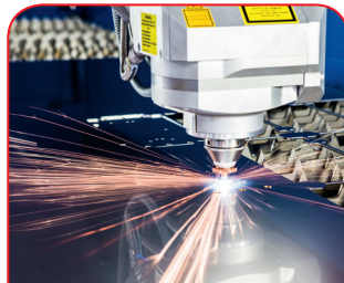
Procesado con láser

Nuestra oferta también incluye el grabado de su logotipo y otros elementos. Naturalmente diseñaremos los grabados en cualquier color que desee.