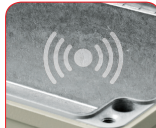
Cajas conforme CEM

La impresión digital resulta especialmente rentable para pocas unidades, así como para representar procesos o imágenes complejas.