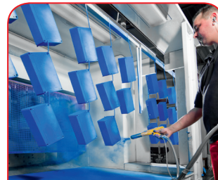
Recubrimiento en polvo

Nuestro propio centro de tratamiento láser nos permite elaborar cajas y placas de acero fino de manera rápida y fiable a la medida de sus requisitos.