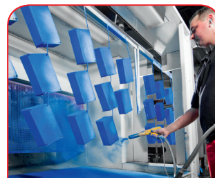
Recubrimiento en polvo

Nuestro propio centro de tratamiento láser nos permite elaborar cajas y placas de acero fino de manera rápida y fiable a la medida de sus requisitos.